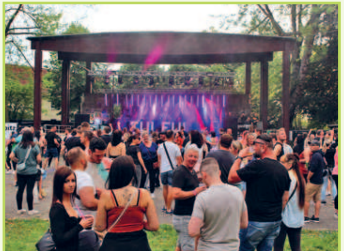
■ 22. Juni „REGIS WIRD LAUT“ – OPEN AIR-Spektakel auf der Freilichtbühne