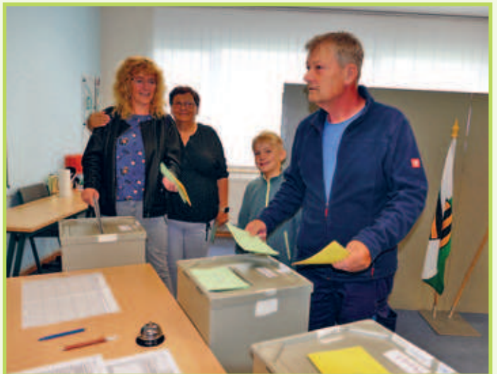
■ 09. Juni Bürgerinnen und Bürger von Regis-Breitungen geben ihre Stimmen zur Wahl zum Europäischen Parlament, zum Kreistag des Landkreises Leipziger Land und zum Stadtrat der Stadt Regis-Breitungen ab.