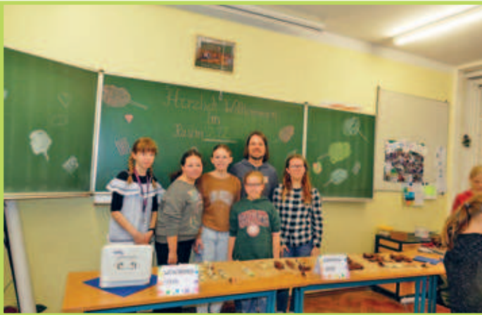
■ 02. Februar Tag der offenen Tür in der Oberschule Regis-Breitungen