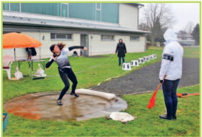
■ 23. März 28. Landesoffener Werfertag im Dr.-Fritz-Fröhlich-Stadion