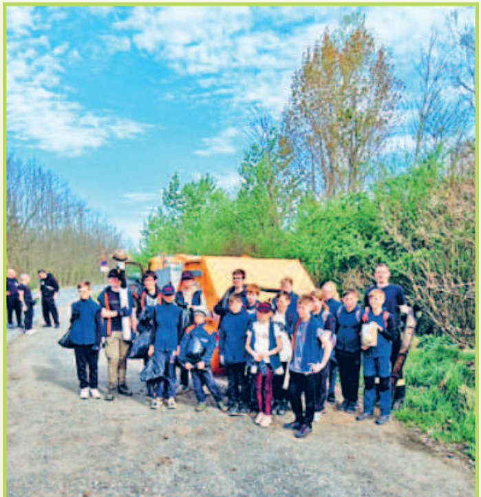
■ 06. April Umwelttag an der Kippenstrasse und am Haselbacher See