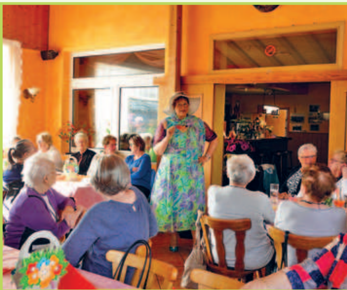
■ 13. März Die Seniorengruppe hat zu einer kurzweiligen Veranstaltung mit Kaffee, Kuchen und lustigem Programm in die Sportgaststätte Heiche eingeladen.