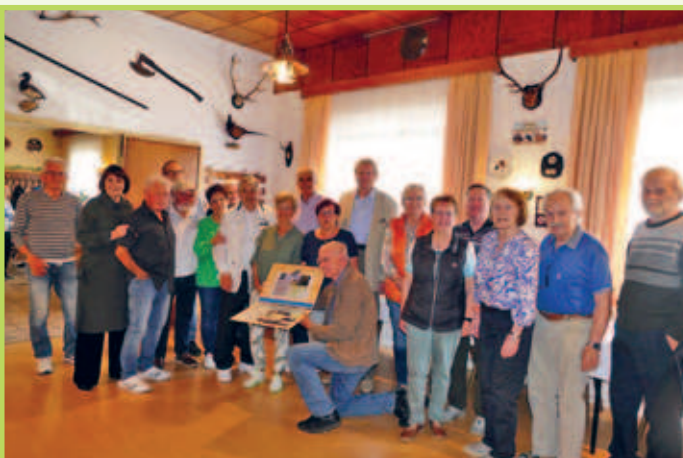
■ 04. Juni Vernissage des Regiser Heimatvereins