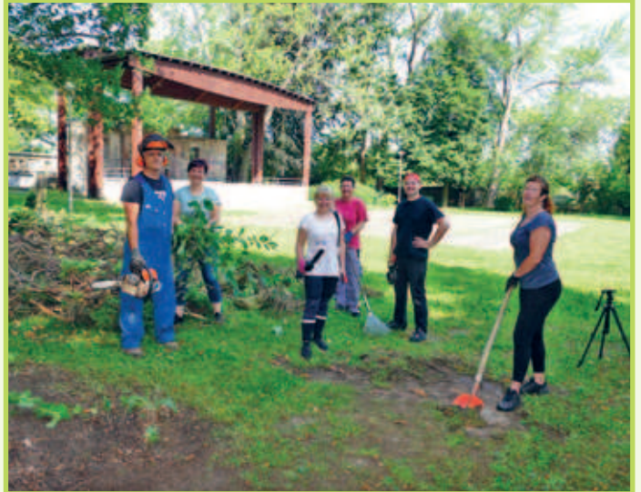
■ 08. Juni Bürgerinitiative „Regis-Breitungen bewegt sich“ Arbeitseinsatz an der Freilichtbühne