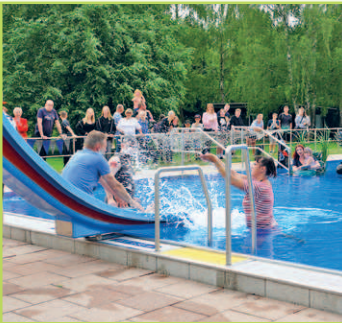
■ 01. Juni Buntes Programm für die ganze Familie zum Badfest & Oldtimertreffen im Freibad Regis-Breitungen