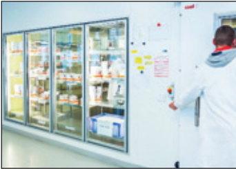
Blutdepot beim DRK-Blutspendedienst Nord-Ost

Etwa 15.000 Blutspenden werden deutschlandweit täglich benötigt, um den Blutbedarf von Kliniken decken und die Patientenversorgung lückenlos sicherstellen zu können. Allein rund 1.750 Blutspenden sind es, die jeden Tag in den fünf Bundesländern des gesamten Versorgungsgebietes des DRK-Blutspendedienst Nord-Ost für Patienten zur Verfügung stehen müssen. Diese Zahlen machen