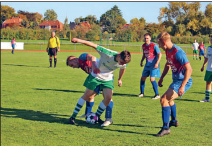
Unser SVR-Heimspiel gegen Groitzsch

Und da ist das offizielle Verbandsportal www.fußball.de mit allen Ligen (Ansetzungen, Ergebnissen, Tabellen). Auch für den Handball gibt es, in ähnlicher Form, solch ein Verbandsportal. Bitte auch die Ankündigungen in der Tagespresse und den genannten Internetportalen beachten.