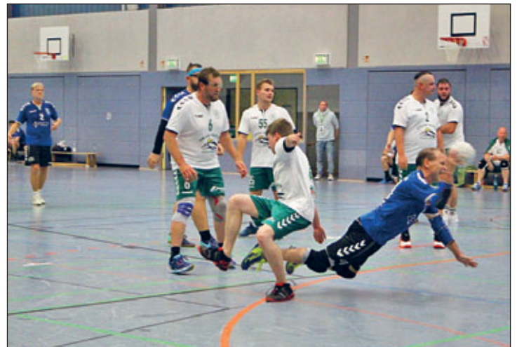
Die Regiser Abwehr hatte alle Hände voll zu tun